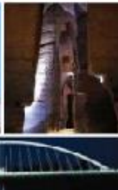
Mise en valeur du Patrimoine