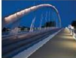
Illuminations festives et événementielles